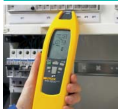
Lokalisering av sikringer/brytere og anvisning til kretser.